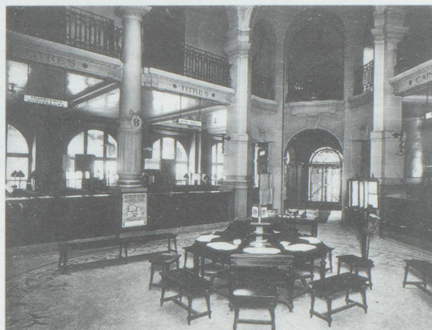
Hall d'entrée de la succursale La Fayette, en 1913

Epargné par les nationalisations de 1945, le CCF entre dans le secteur public en 1982. Pour en ressortir en 1987, première banque à être privatisée. Menée avec succès, l'opération permet à plusieurs partenaires et clients de devenir actionnaires: Alcatel-Alsthom, Rhône-Poulenc, Thomson, les Galeries Lafayette... Au cours des années 80, le CCF se chan-