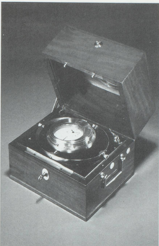
Chronomètre de marine à deux barillets, réalisé dans une boîte étanche et monté sur cardans dans un coffret d'acajou. Modèle acheté par le Ministère de la Marine française entre 1827 et 1831.

La société d'aviation Louis Breguet a fusionné en 1971 avec la Générale Aéronautique Marcel Dassault, pour former Avions Marcel Dassault-Breguet Aviation. ✦