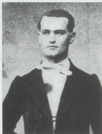
Joseph-Samuel Farinet, le vrai.