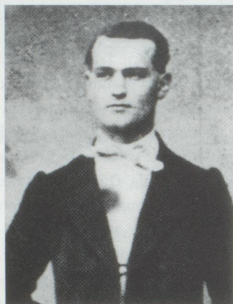
Joseph-Samuel Farinet, le vrai.