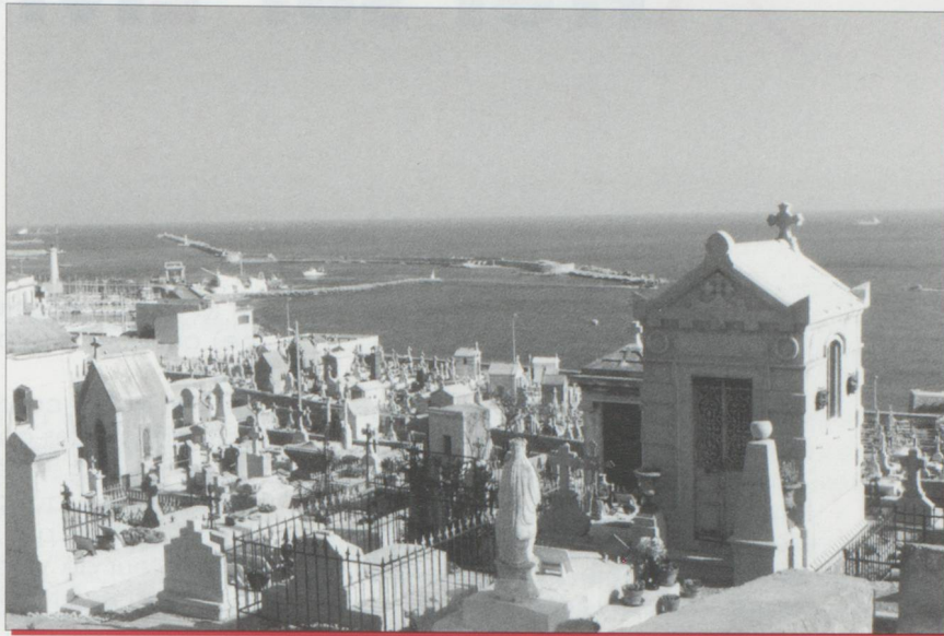
Le cimetière marin de Sète

un substantif à la fois flou et décisif : empathie.