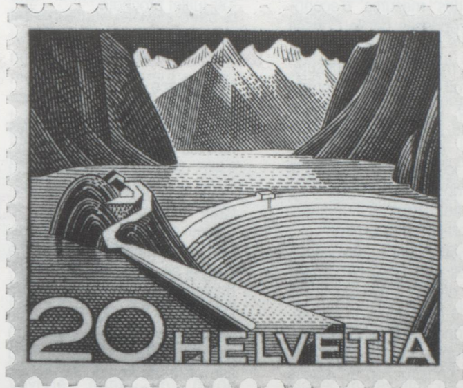
Grand lac artificiel du Grimsel, crêtes du Finsteraarhorn.

Le premier parcours totalise 105 km, et présente 3 049 m de