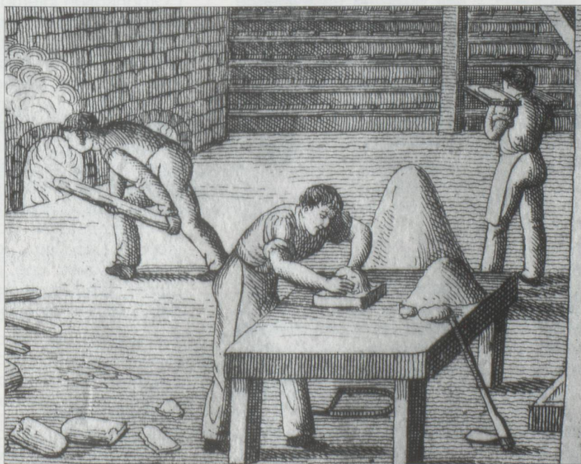
Un atelier au XVIII e siècle.

san, travaillant souvent avec toute sa famille, le tuilier est devenu un ouvrier au XIX ème siècle. La fabrication des tuiles s'effectuant uniquement durant les mois d'été, de nombreux travailleurs saisonniers étrangers - Italiens pour la plupart - ont été recrutés à l'époque. Les fabriques employaient alors également des femmes et des enfants pour effectuer des travaux annexes. L'exposition de Liestal invite à continuer la découverte hors des salles du musée, en organisant des sorties guidées. Les toits anciens de la région sont autant d'œuvres à découvrir, pour qui se donne la peine de lever le nez. Il est également possible de visiter découvrir les techniques de production artisanale ou de visiter une tuilerie des environs.