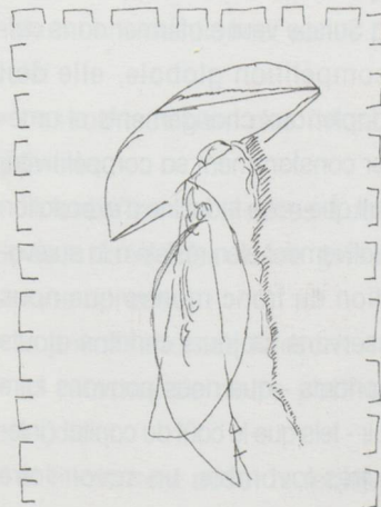
— Bedehring 15 Seidhering für EA —

Cabinet numismatique, jusqu'au 31 août 199