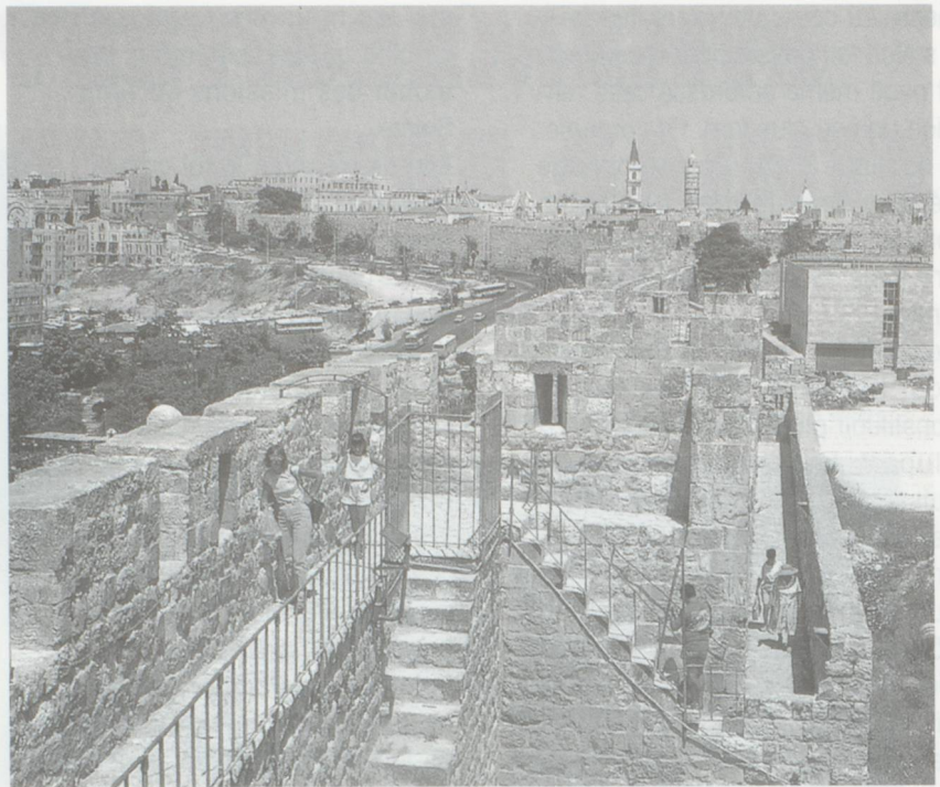
Les murailles de la Vieille Ville ont été construites par Soliman le Magnifique au XVI e siècle.

Bien que largement tombée dans l'oubli à l'heure actuelle, la contribution de Frutiger au développement économique de la Terre Sainte n'en reste pas moins éminente. Il a ainsi participé au lancement et au financement de la première voie