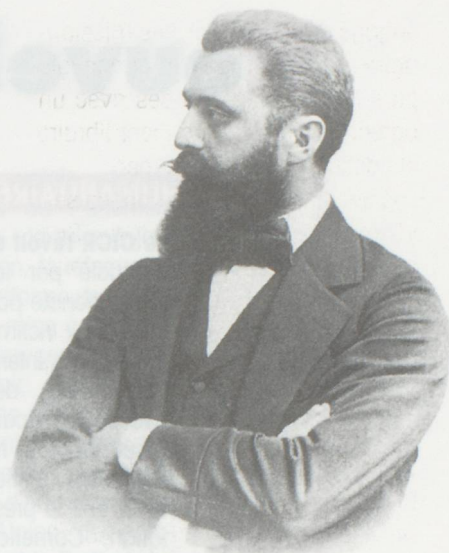
Theodor Herzl, fondateur du mouvement sioniste.