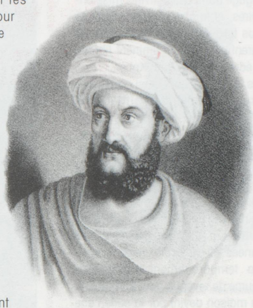
Johann Ludwig Burckhardt.