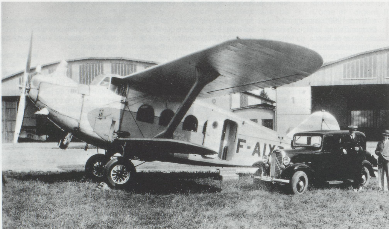
Un avion de « Rapid-Azur » dans les années trente.