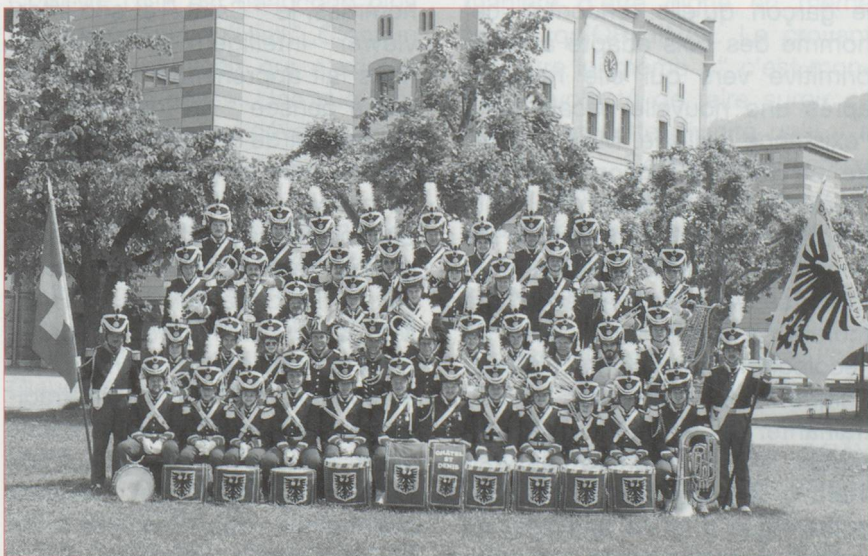
La fanfare de Châtel-Saint-Denis au grand complet.

Il n'est sans doute pas le seul. Ecrivez-nous; comme il l'a fait lui-même un beau jour. ■