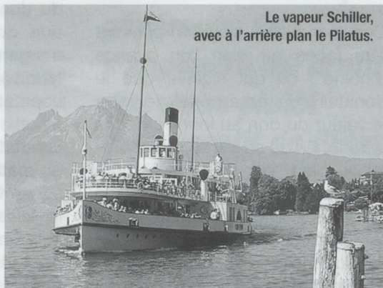
Le vapeur Schiller, avec à l'arrière plan le Pilatus.

La vapeur à roues Schiller va suivre dès cet automne une cure de jouvence. Cette révision générale d'une des plus belles unités du Lac des Quatre-Cantons a été devisée à 5,8 millions de francs suisses. Une grande partie du coût des travaux sera supportée par l'Association régionale des amis de la vapeur. Le Schiller est sorti en 1906 des ateliers Sulzer frères de Winterthur. Ce bateau-salon a la réputation d'être l'un des plus beaux vapeurs à aubes des lacs helvétiques.