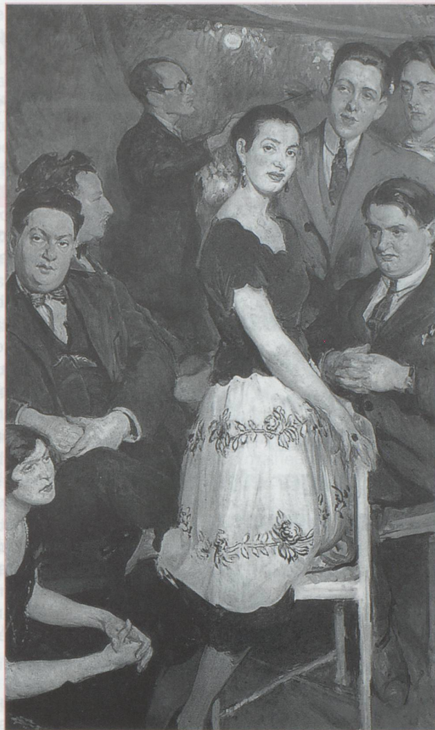
Le Groupe des Six peint par Jacques-Émile Blanche (1861-1942). À l'extrême gauche de la toile, on reconnaît Germaine Tailleferre, Darius Milhaud et Arthur Honegger (de profil).

six mélodies sur des poèmes de Guillaume Apollinaire, le héros au front transpercé, s'allie au Groupe des Six (Auric, Durey, Honegger, Milhaud, Poulenc, Tailleferre, auxquels se joint Jean Cocteau). C'est déjà, après la victoire, le Bœuf sur le Toit.