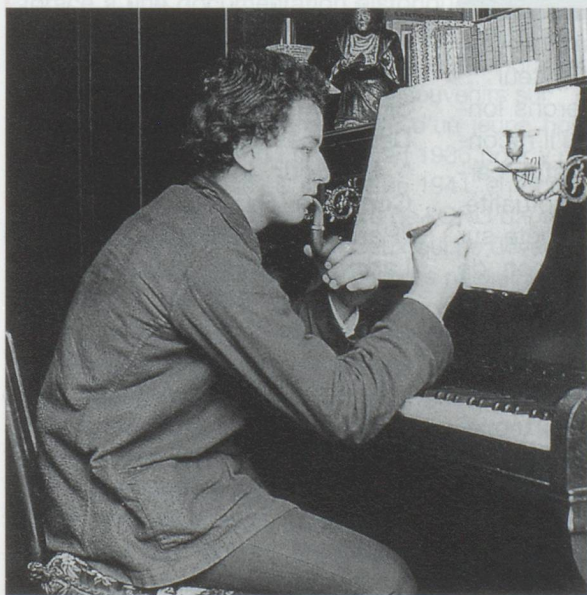
À Paris, hiver 1913-1914.

La France, la Suisse. Toujours sagement, Honegger part faire son École de recrues au moment de la guerre et revient à Paris, rue de Madrid, pour étudier cette fois avec Charles-Marie Widor et Vincent d'Indy. La musique religieuse et le post-wagnérisme. Il se fixe à Paris, fréquente les "montparnos", devient l'ami de Darius Milhaud, écoute Satie, écrit