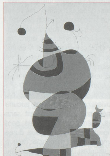
Femme, oiseau et étoile Hommage à Picasso - 1970

La Fondation Pierre Gianadda consacre sa grande exposition d'été au maître catalan. Un parcours complet en 125 œuvres, dont une rareté de 1925, une toile surréaliste intitulée «Ceci est la couleur de mes rêves», provenant d'une collection privée américaine. L'occasion d'admirer l'univers poétique et onirique de Miró sous ses multiples facettes : sans délaisser l'œuvre picturale, l'exposition rappelle que Miró fut aussi un sculpteur, un céramiste et l'illustrateur des plus fines plumes de son temps (Desnos, Jarry, Eluard, Leiris, Char ou Prévert).