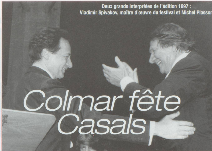
Deux grands interprètes de l'édition 1997 : Vladimir Spivakov, maître d'œuvre du festival et Michel Plasson

L e Festival de Colmar rend toujours hommage à un instrument et à l'un de ses virtuoses. Sans constituer à proprement parler un thème, cette formule contribue incontestablement à la cohésion des différents concerts où la variété des œuvres et des genres peut pleinement se développer. Cette année l'instrument était le violoncelle et le virtuose honoré avait nom Pablo Casals. Peu d'artistes ont fait autant pour leur instrument que ce catalan qui fut au surplus un symbole politique, un créateur de manifestations musicales où le recueillement prime et, on le sait moins, un compositeur de talent. De même qu'il mit des années avant de se décider à jouer en public les Suites de Bach. Casals mit dix-sept ans à élaborer son oratorio de Noël, El Pessebre (la crèche). L'humaniste qu'il était conte avec une simplicité et un lyrisme touchants ce message de paix et de fraternité. Le début de l'oeuvre est certes un peu lent mais la seconde partie s'illumine avec l'arrivée des Rois mages et de leur cortège d'animaux. Le Te Deum final est grandiose. Le Chœur de Valence aux voix si typiquement ibériques et