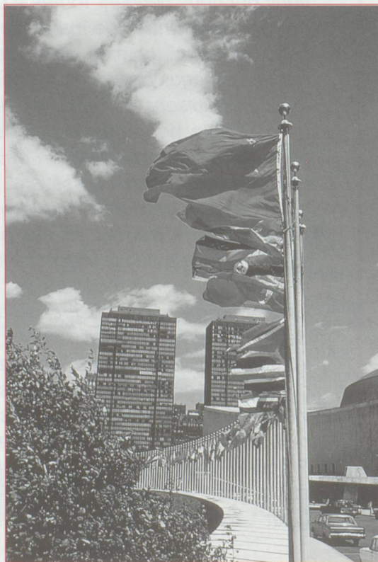
Le débat sur l'adhésion de la Suisse à l'ONU est relancé. Le vote à l'unanimité de l'Assemblée générale d'une résolution sur la neutralité permanente du Turkménistan rend obsolète la principale objection avancée par le peuple et les cantons en 1986. Les socialistes projettent le lancement prochain d'une initiative.

L'industrie militaire suisse est en voie de restructuration : pour pouvoir s'adapter au marché, les quatre entreprises fédérales d'armement devraient être partiellement privatisées et