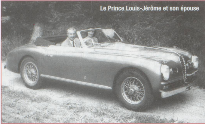
Le Prince Louis-Jérôme et son épouse

dans le conflit. Mais Sedan arriva trop tôt. Plon-Plon s'efforça encore d'aider Napoléon III à bâtir un plan de retour en France. L'Empereur était prêt à cette nouvelle aventure quand il mourut des suites d'une opération qu'il avait lui-même souhaitée.