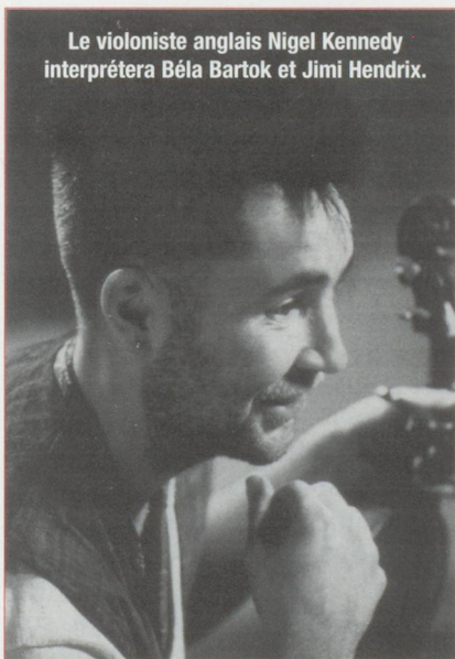
Le violoniste anglais Nigel Kennedy interprétera Béla Bartok et Jimi Hendrix.

Pour renseignements et réservations, s'adresser à : Verbier Festival et Academy, Case postale 1936, Verbier, Suisse. Tél. : 00.41.27.771.82.82.