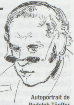
Autoportrait de Rodolph Töpffer

quelles elle appartient. Dès le début du XX ème siècle, de nombreux étrangers séjournent en Suisse :