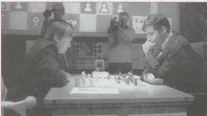
Karpov conserve son titre à Lausanne : pour la première fois dans l'histoire des Championnats du monde d'échecs, le titre s'est joué au termes de parties rapides. Les deux premières auront suffi au russe (à gauche) pour défaire son challenger, l'indien Viswanathan Anand.

de l'emmental va demander l'Appellation d'Origine Contrôlée.