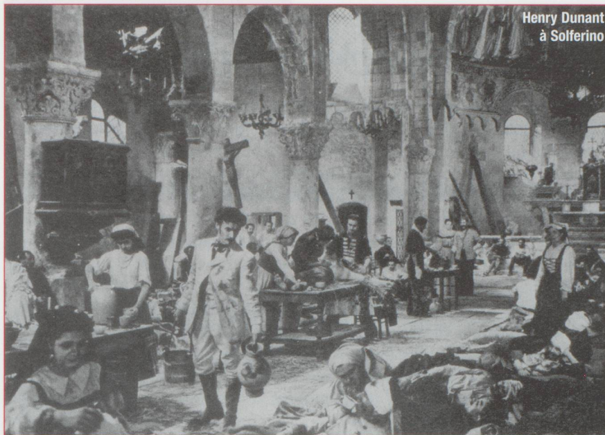
Henry Dunant à Solferino

l'absence de concessions pour les sources. Sur le champ de bataille de Solferino, il se lança à corps perdu dans la distribution des rares gouttes d'eau épargnées par la bataille.