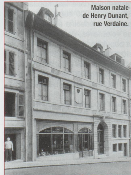
Maison natale de Henry Dunant, rue Verdaine.