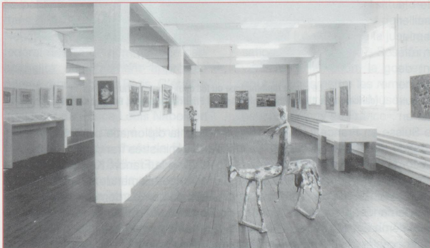
La Fondation pour l'art naïf suisse de St-Gall fête ses dix ans. Dix ans après sa création, sa collection compte 1300 œuvres de 80 artistes et 46 expos à son actif. L'institution, qui dispose depuis 1995 de son propre musée à St-Gall, a édité 17 publications. Renseignements : 00 41 71 223 58 57

Le comédien Jean-Luc Bideau envisage de quitter la Comédie Française. Il estime qu'avec l'actuel administrateur, il n'a pas la possibilité d'avoir des rôles intéressants. En attendant, il se prépare à jouer "Les Huissiers" de Michel Vinaver au Théâtre de la Colline.