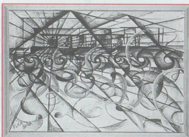
Automobile en course, Giacomo Balla, 1913-1914.