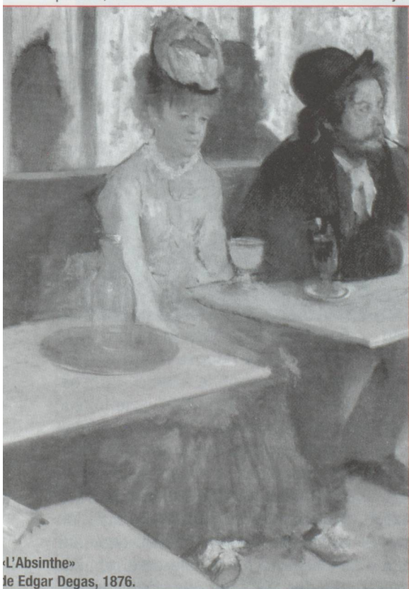
«L'Absinthe» de Edgar Degas, 1876.

Vers 1870, l'absinthe jusqu'alors réservée à une élite se démocratise. Elle ne fait plus l'exclusivité des beaux établissements mais gagne les petits bistrotts, les caboulots qui regorgent de monde les soirs de paye. Les marchands de vin, puis les fruitiers et même les charbon-