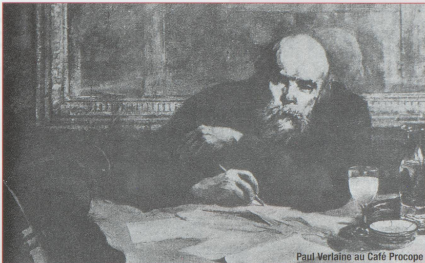
Paul Verlaine au Café Procope

À l'époque, cette affaire a rejilli sur tout le canton, notamment sur le