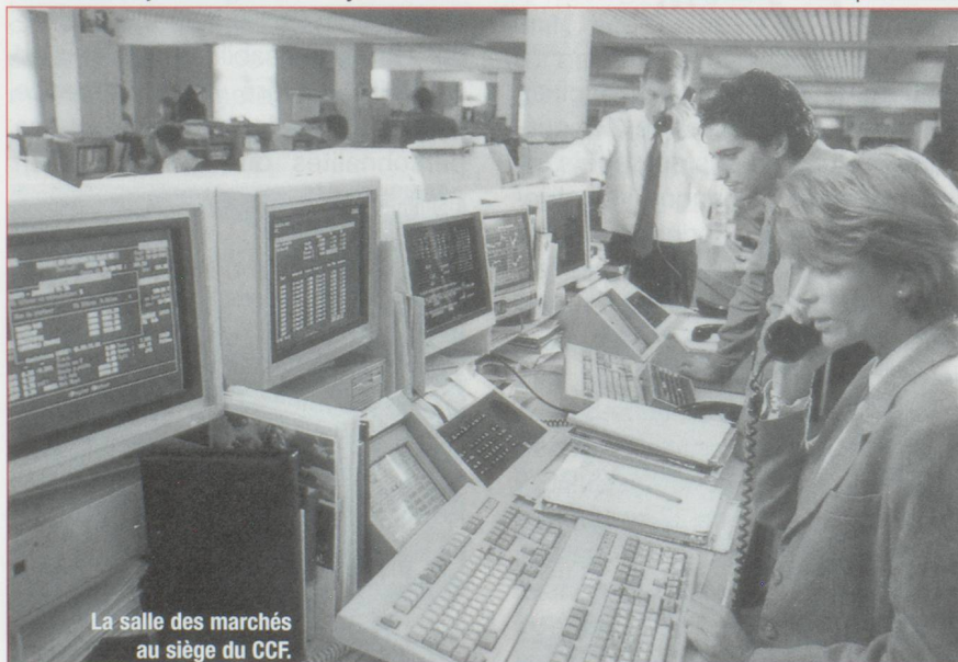
La salle des marchés au siège du CCF.