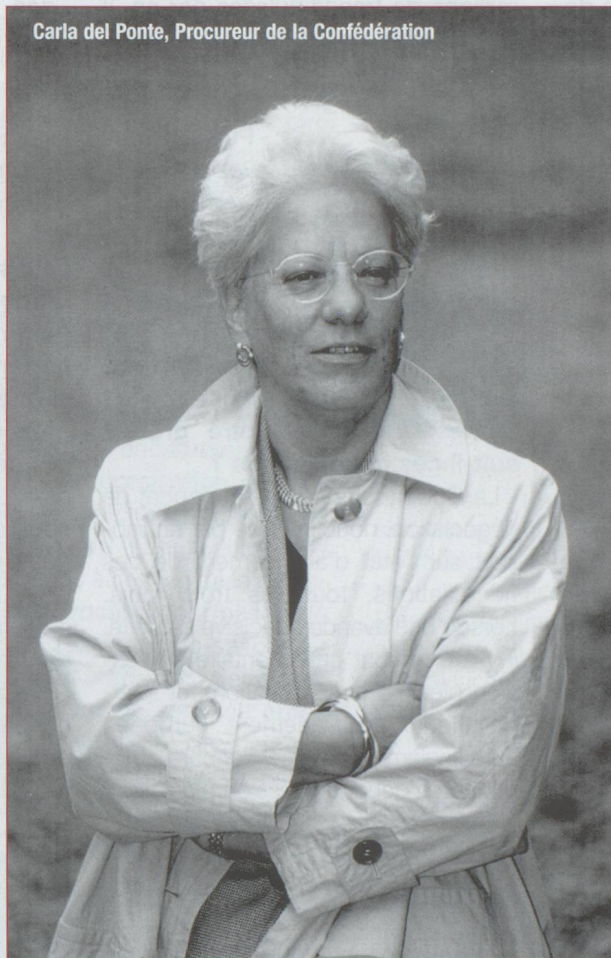
Carla del Ponte, Procureur de la Confédération

- En septembre 1995, un groupe d'experts qualifiait la question des mafias de "menace non militaire de niveau stratégique" et plus loin écrivait "Drogues et mafias, comme le terrorisme, ne sont pas que des problèmes de société. Ils touchent aux intérêts majeurs des États et des fédérations au sens large du terme (par exemple l'Union européenne)". Les suivez-vous ?