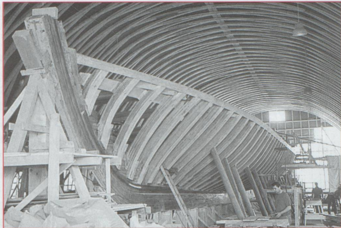
La galère de Morges, un chantier unique au monde.