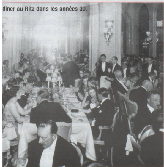
dîner au Ritz dans les années 30.

À Baden-Baden, Ritz applique les mêmes préceptes d'animation qu'à Lucerne. La ville, qui reçoit la visite du Kaiser, se remplit. De nouveau, Ritz est chargé d'organiser des fiançailles, celles de la fille du prince Radziwil, écuyer de l'empereur. La fête est gran- diose et attire l'attention d'un financier qui vient de faire construire un hôtel sur les bords de la Tamise : le Savoy. Ce der- nier invite Ritz à l'inauguration. L'hôtelier y remarque beaucoup de fautes qu'il note et transmet au propriétaire. Celui-ci ne veut pas en tenir comp- te et Ritz retourne à Baden-Baden.