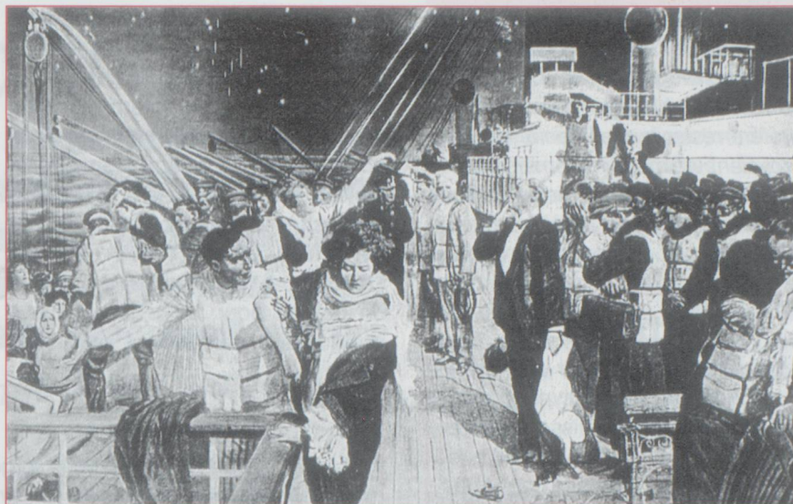
« un certain nombre de passagers ont préféré rester sur le Titanic, car ils le croyaient vraiment insubmersible. »

Les légendes, souvent fausses, qui courent autour du Titanic sont nombreuses : " Le nombre de canots de sauvetage sur le Titanic , 16, était réglementaire à l'époque. La route était normale, et le capitaine s'est même détourné un peu au Sud dès qu'il a eu connaissance des risques. Le drame du Titanic résulte en fait d'un engrenage infernal : " Ce n'est ni la faute du capitaine Smith, ni de l'officier Murdoch, ni de la grève des mineurs, ou de la qualité de l'acier de la coque. Imaginez un tableau de bord avec une centaine de boutons.