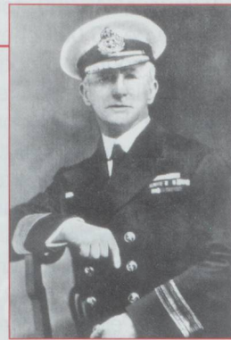
Sir Arthur H. Rostron, capitaine du Carpathia