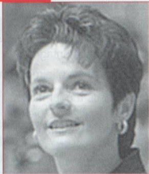
Joseph Deiss (Affaires étrangères) et Ruth Metzler (Justice), les deux nouveaux conseillers fédéraux élus en remplacement de Flavio Cotti et Arnold Koller