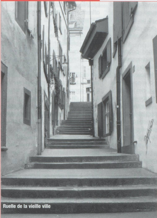
Ruelle de la vieille ville