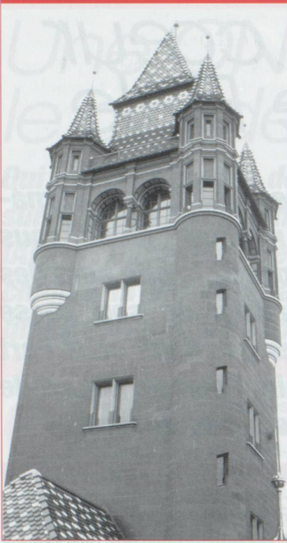
Le Beffroi de l'Hôtel de Ville

maison, cachée au fond d'une cour fleurie, qui fut autrefois assidûment fréquentée par Paracelse et Erasme de Rotterdam. Outre toute une collection de médicaments, d'ustensiles de laboratoire, de réclames, vous admirerez l'aménagement d'une officine de jadis avec ses rayonnages d'admirables pots.