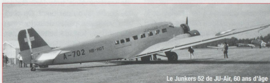
Le Junkers 52 de JU-Air, 60 ans d'âge

Depuis la première fête aérienne de 1970, le meeting de la Ferté-Alais a de plus en plus de succès. La Patrouille de France y participe pour la première fois en 1978. Elle restera très fidèle à cet exceptionnel rendez-vous en offrant au public une présentation saisissante d'une pré-