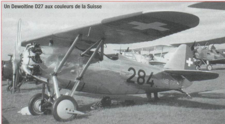
Un Dewoitine D27 aux couleurs de la Suisse