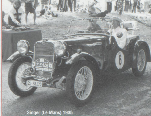
Singer (Le Mans) 1935

équipées de moteurs très puissants. N'oublions pas quelques carrossiers talentueux et les usines de montage, aujourd'hui fermées, qui ont fait pendant longtemps les beaux jours de General Motors en Suisse. Parti pour un raid le long des jolies routes de France de Bâle à Paris, nous nous sommes évadés pour un voyage helvétique, dans le temps, guidés par une même passion de l'automobile. +