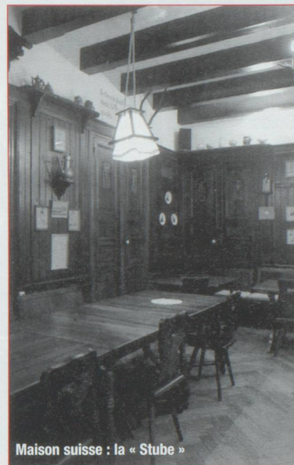
Maison suisse : la « Stube »

Cette forte personnalité, nommée en 1917, et venue de Suisse contrairement à ses prédécesseurs issus de Marseille, participa à la création de la Maison suisse, 7 rue d'Arcole, acquise grâce à une souscription lancée