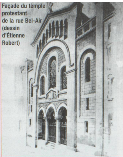
Façade du temple protestant de la rue Bel-Air (dessin d'Étienne Robert)