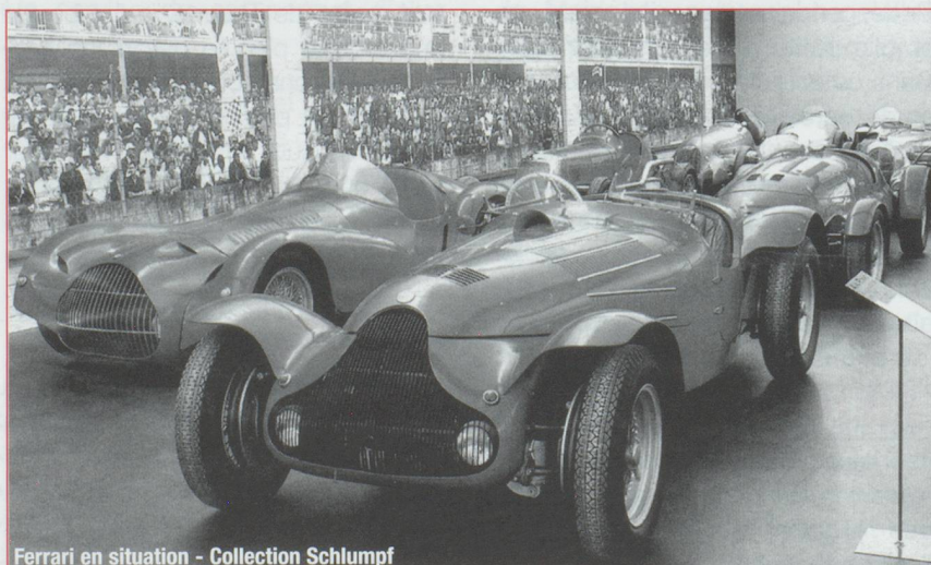
Ferrari en situation - Collection Schlumpf

Une collection pour partie appartenant à la fondation et habilement complétée par des collections privées. Au sein du château du XI e vous découvrirez 21 voitures dont