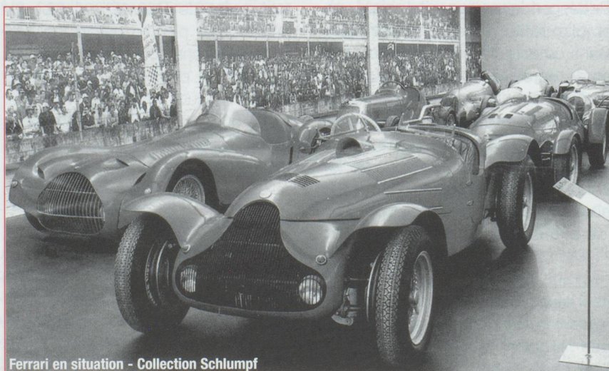
Ferrari en situation - Collection Schlumpf

Une collection pour partie appartenant à la fondation et habilement complétée par des collections privées. Au sein du château du XI e vous découvrirez 21 voitures dont