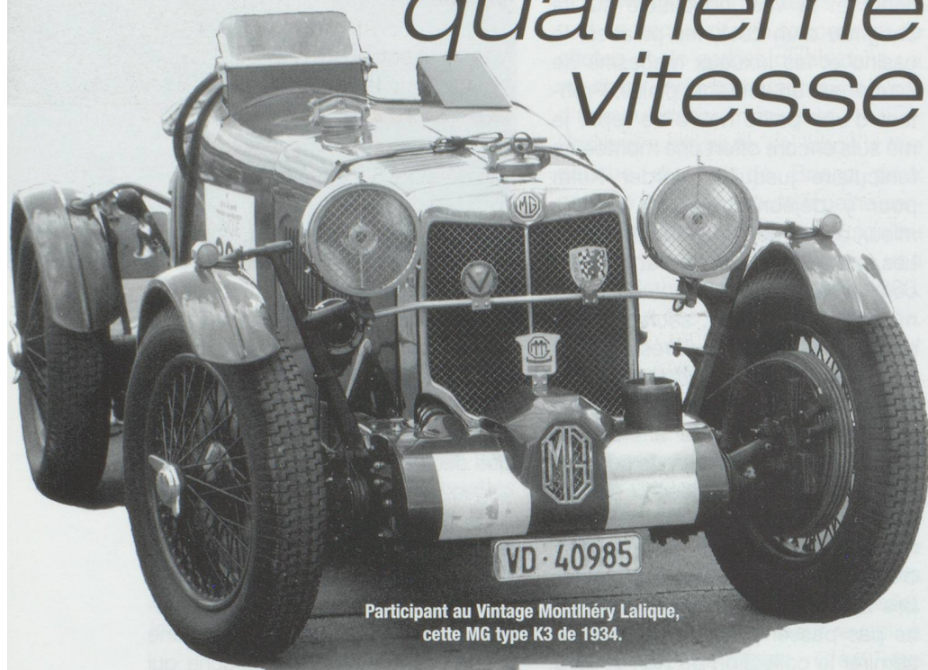
Participant au Vintage Monthéry Laliq, cette MG type K3 de 1934.

Pic Pic, Hispano - Suiza, Martini, Moser, Zedel, Egg, Tribelhorn, Turicum, Dumon... Que de noms mythiques, pour les passionnés de l'automobile, mais aussi que d'histoires passionnantes. À l'approche des vacances nous vous proposons un tour de la Suisse en 12 musées.