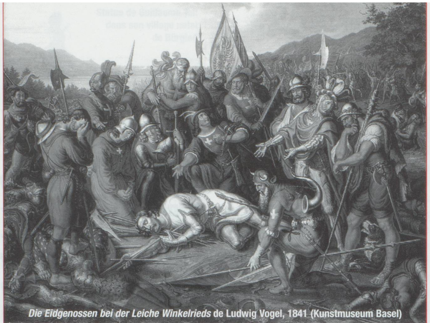
Die Eidgenossen bei der Leiche Winkelrieds de Ludwig Vogel, 1841 (Kunstmuseum Basel)

À la fin du XIV e siècle les huit cantons forment déjà une communauté indépendante, qui peut être appelée