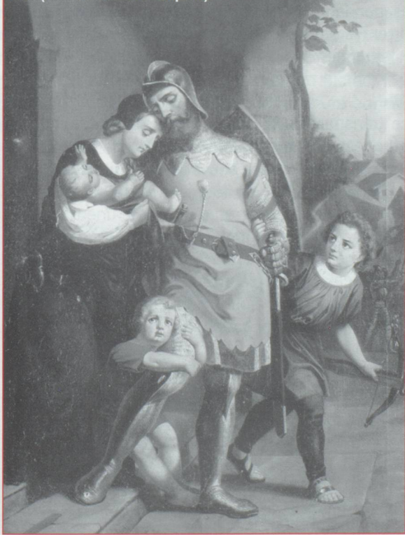
Winkelrieds Abschied, nach Theodor Deschwanden, 1861 (Rathausmuseum Sempach)

Vers midi le 9 juillet, le combat s'engage dans un vaste champ entouré de bois, proche de la ville de Sem-