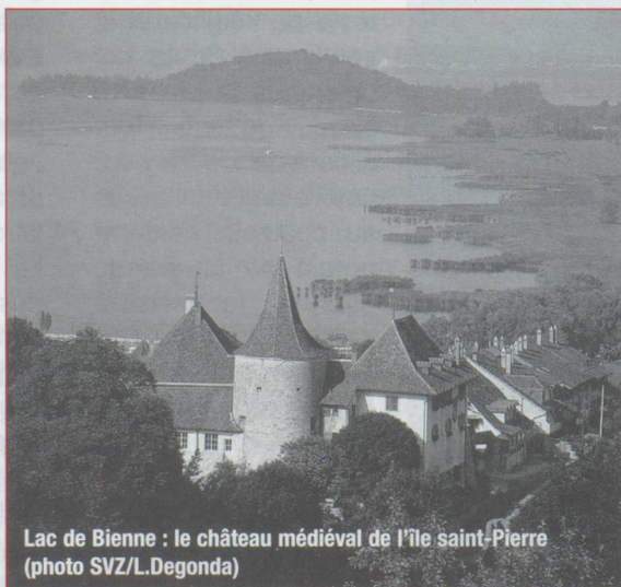
Lac de Bière : le château médiéval de l'île saint-Pierre

Au sud, en forme d'« i » majuscule allant du bas vers le haut, Auvernier, resté village viticole, est devenu aujourd'hui un lieu de résidence privilégié. Il vaut la peine de s'arrêter sur les hauts de la commune pour admirer les toits de ses demeures avant de descendre la grand-rue, bordée de belles maisons du XVI e siècle pour se rendre à la cave, goûter le fameux chasselas gouleyant. Colombier, avec son terrain de Plaineyse, est devenu un des centres de l'aviation légère en Suisse, Vaux-Marcus, situé légèrement sur la hauteur, se targue d'avoir un superbe château. Au nord, Saint-Blaise, avec