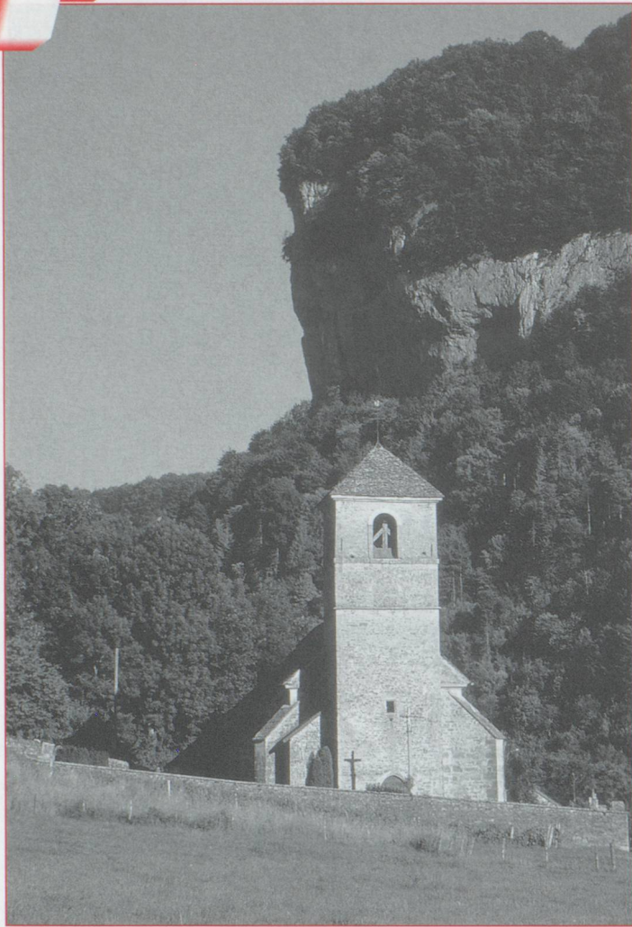
Baume-les-Messieurs : un site exceptionnel pour l'un des plus beaux villages de France

▷ Ledoux. Une visite s'impose d'autant à l'exposition permanente "À la recherche de la cité idéale" qui mériterait qu'on lui accorde quelques heures, tant les documents rassemblés y sont passionnants. Parmi tous les projets utopiques de villes, on trouve par exemple celui de Versoix, imaginé au XVIII e siècle par le duc de Choiseul et Voltaire, dont nous vous parlerons dans un prochain numéro.