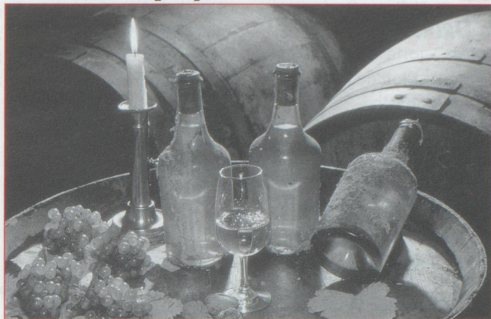
Le vin jaune, spécialité unique de la région