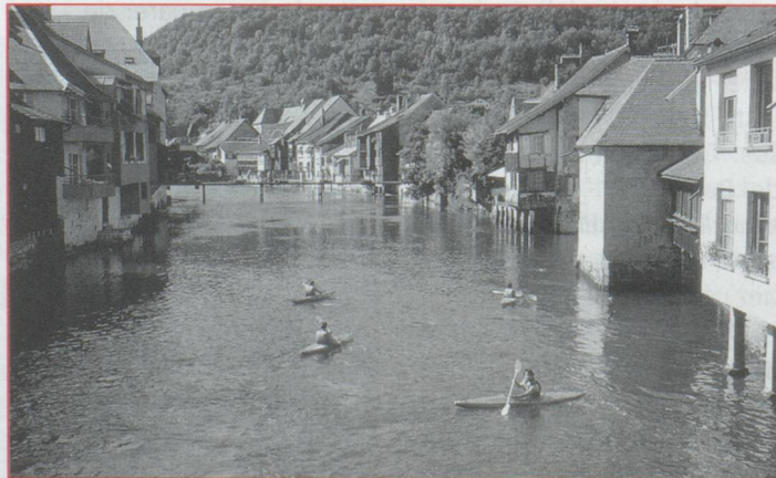
Le canoë est le moyen de transport idéal pour admirer Ornans, la "Venise franc-comtoise"

où est né Gustave Courbet. Les plus sportifs trouveront leur bonheur en se frottant au parcours jungle aménagé à quelques encâblures du bourg. Mais le sport peut aussi aller de pair avec la découverte. Pourquoi ne pas découvrir la splendide vallée de la Loue en 4x4. Un