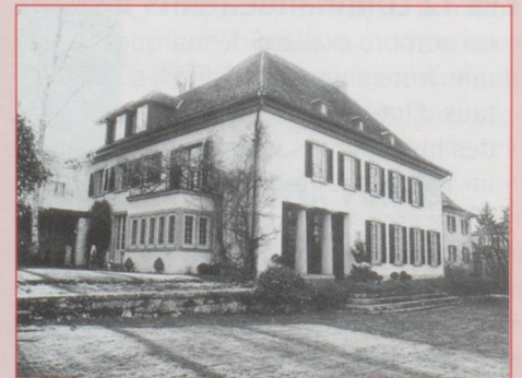
L'effondrement de l'entreprise Pfister & Duttweiler oblige Gottlieb Duttweiler à se séparer de la maison de maître qu'il s'était fait construire à Ruschlikon.

Cet échec, loin de le terrasser, lui fera prendre conscience des valeurs humaines de l'entreprise. La santé de son épouse contrariant ses projets en Amérique du Sud, il repart en Allemagne, en Pologne, en