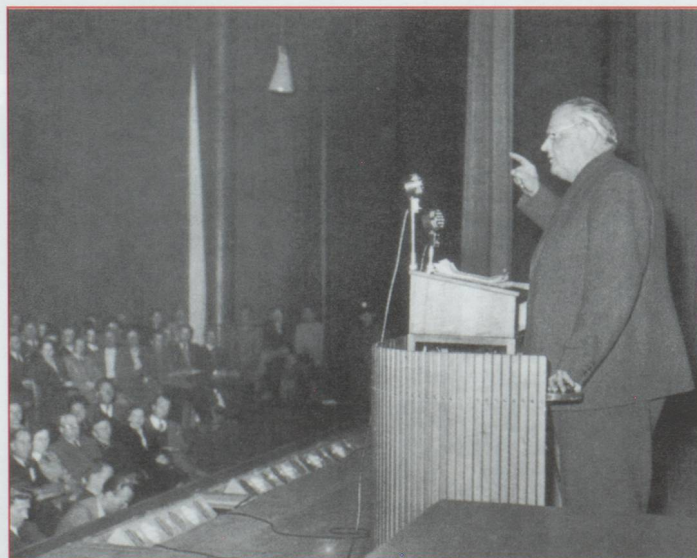
Gottlieb Duttweiler sait parler au cœur des gens

hommes politiques qui osent se fournir dans les camions magasins. Les autorités publient dans la presse des appels à ne pas soutenir cette entreprise qui "condui-