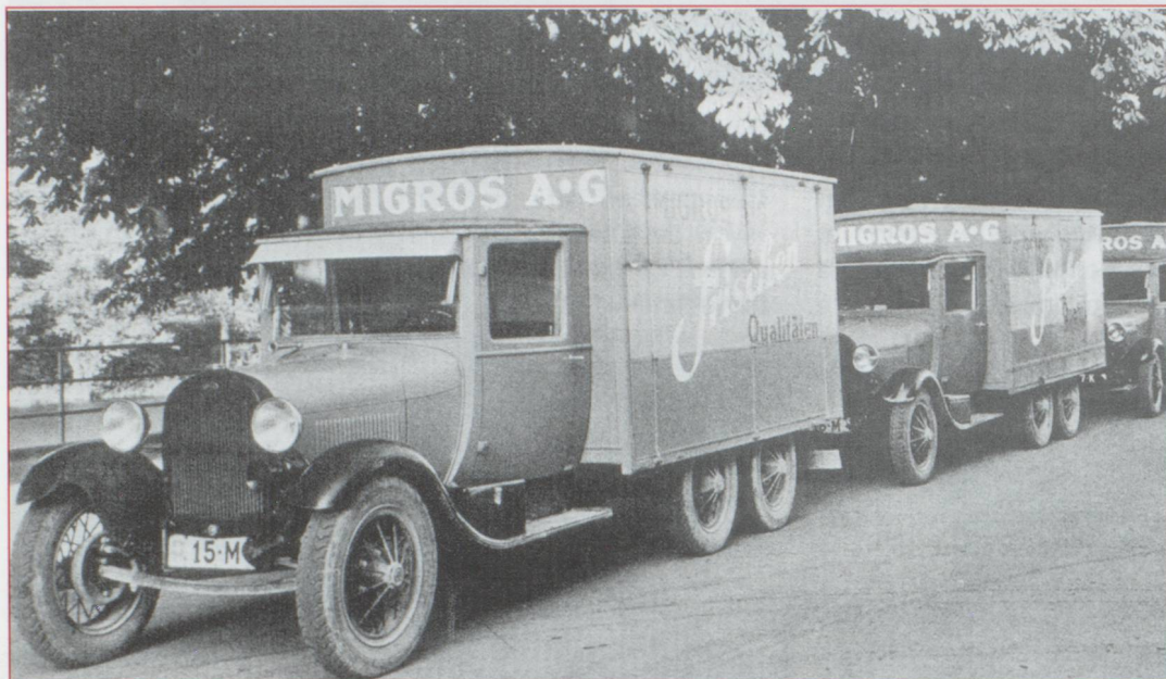
Les camions Ford de Migros.

Qui ne connaît pas en Suisse la Migros et qui n'y a jamais fait ses courses ? Mais l'historique de capitalisme social de cette œuvre parfois encensée et parfois décriée est moins connu.