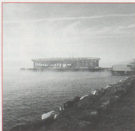
L'Arteplage de Neuchâtel

Non sans raison, Bienne a été baptisée la cité de l'avenir. Le sérieux de l'industrie va-t-il l'emporter sur le rêve ? N'y comptez pas trop, car on a su garder le sens du juste milieu. L'arteplage ressemble à un embarcadère ultramoderne prêt à accueillir les plus beaux paquebots pour d'autres voyages symboliques. Les expositions s'inspirent du thème "Pouvoir et Liberté." Elles parlent des liens et des contradictions entre l'individu et la société, elles évoquent la réalité sociale et l'imaginaire, l'argent et ce qu'il ne permet pas d'acheter... Vous y découvrirez les richesses de