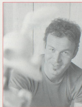
photo dans un album de Titeuf. Cela veut dire : en fait tout cela n'est pas vrai, ce n'est que dessiné. Quand je suis lecteur, j'ai envie de croire quand je suis dans le livre, que c'est vrai. Je n'ai pas envie qu'on me casse mon truc. Donc je m'efforce de ne pas avoir de références...

Depuis 1993, la Suisse lutte pour la réduction du danger que représentent les mines. Elle a été l'un des premiers États signataires (le 3 décembre 1997) de la Convention sur l'interdiction de l'emploi, du stockage, de la production et du transfert de mines antipersonnel et sur leur destruction (Convention d'Ottawa). La Direction politique du Département fédéral des affaires étrangères (DFAE) coordonne les actions de la Suisse dans la lutte contre les mines antipersonnel. Elle finance et suit des projets de déminage, particulièrement en Europe et au Mozambique, pour 4,5 millions de francs suisses par an. Quant à la Direction du développement et de la coopération (DDC), elle collabore avec le CICR, l'OMS et l'UNICEF et développe une stratégie globale d'aide aux victimes qui couvre la prévention et la réintégration aussi bien que la question du droit des victimes.