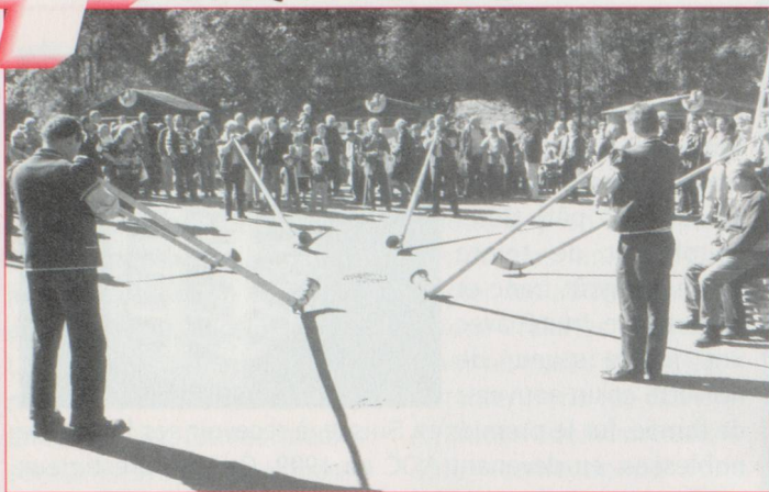
Le cor en chœur

▷ breux des environs et de plus loin pour les admirer. Une véritable haie d'honneur entoure la route tout au long du petit bourg. Mais le troupeau n'en a cure, il sait qu'il rentre à la maison et poursuit son chemin jusqu'au but final. C'est la fête au village. Les joueurs de cor des Alpes célèbrent l'événement. La fanfare s'en donne à cœur joie et les chœurs mixtes entonnent leur plus beau