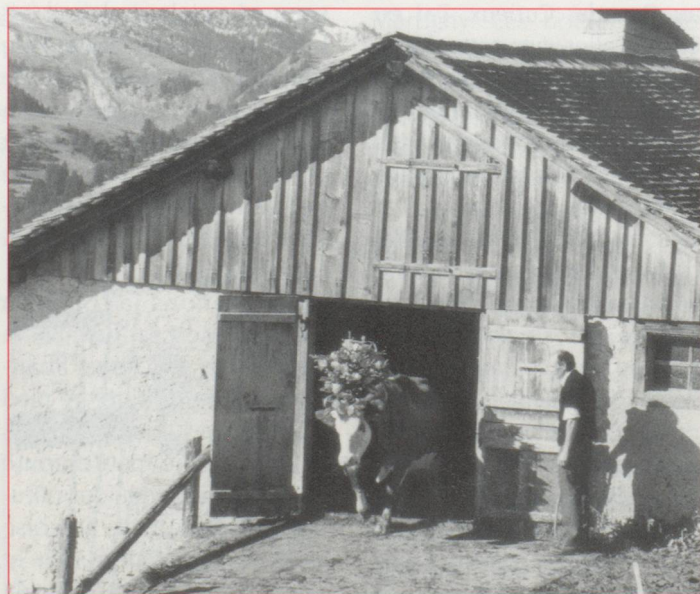
Le grand départ