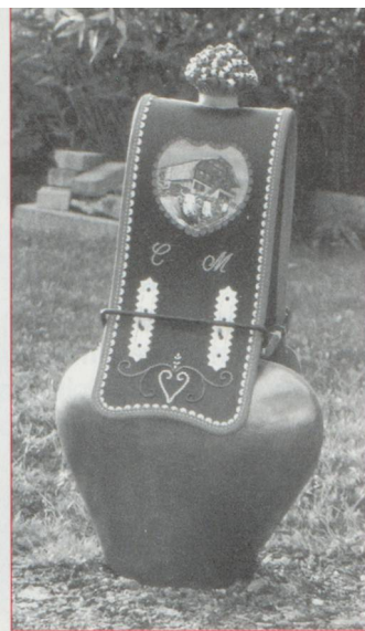
Une toupie avec son beau collier.

L'ambiance est chaleureuse, la joie est dans les cœurs, on sourit, on se parle, l'amalgame se fait entre les gens du pays et ceux d'ailleurs. Le temps passe vite. Il faut songer à repartir vers la plaine et ses brumes automnales en se promettant de revenir l'an prochain pour vivre une nouvelle désalpe.