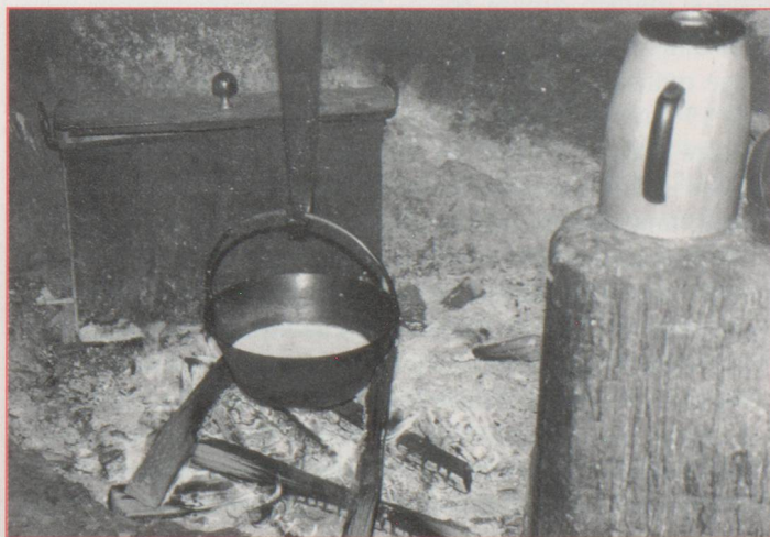
La préparation du café.

Dans l'étable, c'est le moment de la dernière traite. Exceptionnellement le lait frais sera descendu au village et ne deviendra pas fromage. Comme ce matin-là, je ne verrai pas la fabrication de l'Étivaz, on me la raconte : La traite est faite deux fois par jour. Le lait du soir, conservé au frais pendant la nuit, est écrémé alors que celui du matin ne l'est pas afin d'obtenir un juste dosage en matière grasse. Tout ce lait est mélangé dans un chaudron géant. Il sera chauffé sur le feu de bois pour être transformé en fromage à la manière traditionnelle avec le savoir-faire ancestral du berger dont les traces remontent au XIV e siècle. ▷