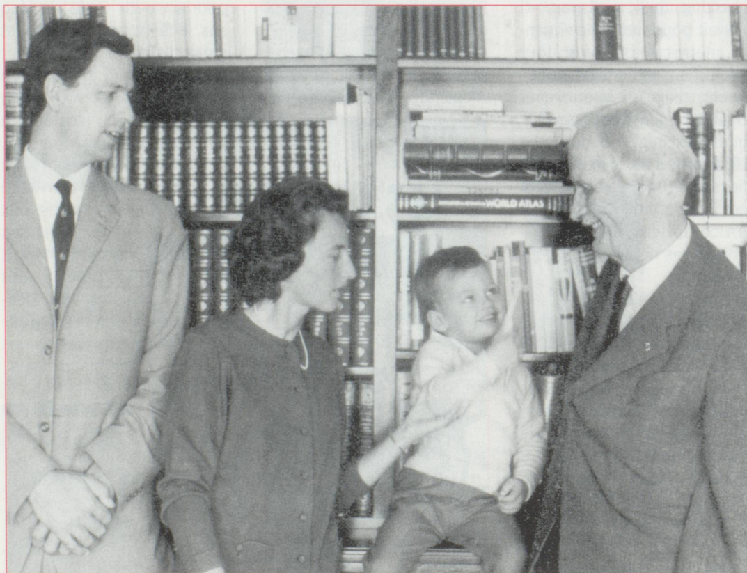
Trois générations de Piccard - de gauche à droite : Jacques et sa femme, Bertrand et Auguste.

Avec le navigateur anglais Brian Jones, ils ont été les premiers à réaliser l'exploit de boucler le tour du monde sans escale en vingt jours, atterrissant au cœur du désert égyptien le 21 mars à 6 h 30 du matin.