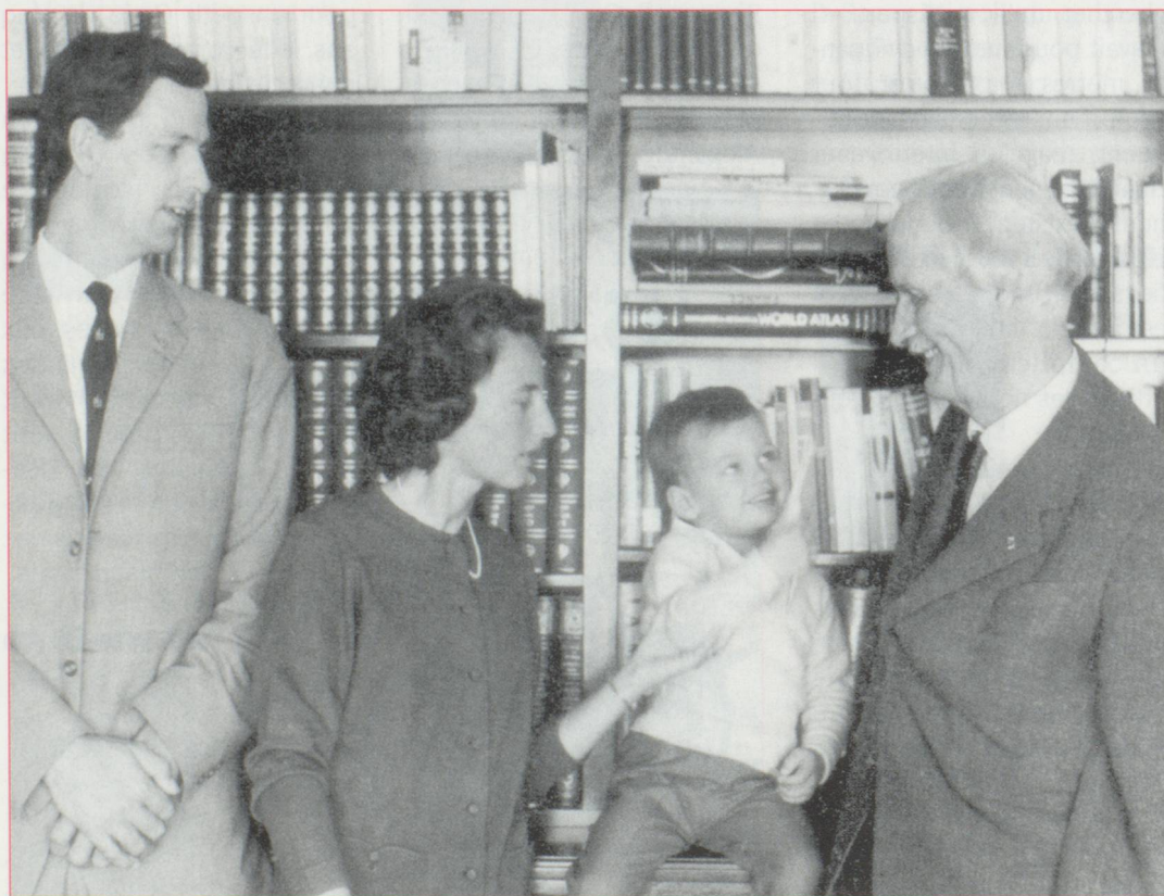
Trois générations de Piccard - de gauche à droite : Jacques et sa femme, Bertrand et Auguste.

Avec le navigateur anglais Brian Jones, ils ont été les premiers à réaliser l'exploit de boucler le tour du monde sans escale en vingt jours, atterrissant au cœur du désert égyptien le 21 mars à 6 h 30 du matin.