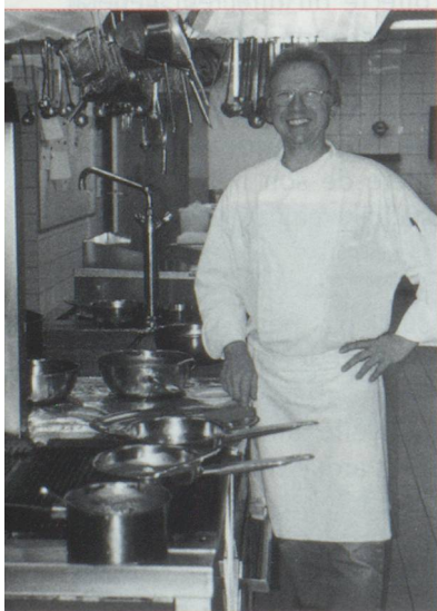
Le chef du Royal et sa cuisine