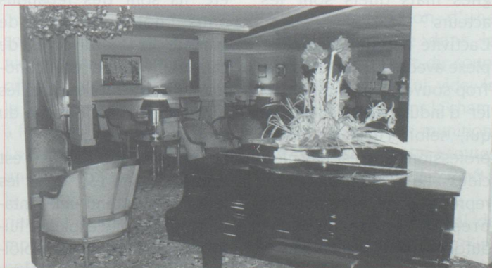
Salon de l'hôtel Royal

22 h 30 : Le réceptionniste de nuit arrive. Il enregistre toutes les consignes et prend note des demandes de réveil. Dans la salle du petit déjeuner, on commence la mise en place.