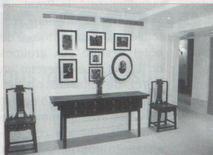
Entrée de l'hôtel Kipling

On soigne le détail, chaque mois il y a un petit plus.