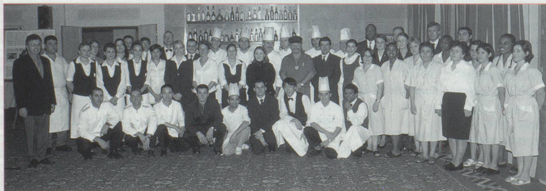
L'équipe du Royal

15 h 30 : Changement d'équipe, le personnel du matin, femmes de chambres et réceptionnistes sont remplacés par ceux du soir. La barmaid commence son service et va s'enquérir des souhaits des clients installés au salon en atten-