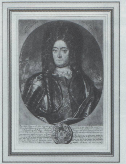
François Le Fort, au service de la France, des Provinces-Unies et de la Russie

le projet d'installer, dans l'ancien corps de garde des Suisses au Château de Versailles, un modeste musée franco-suisse. Des familles de descendants de ces "Suisses du Roi" ont mis de nombreux portraits, uniformes, armes, drapeaux, tambours, décorations, sceaux, traités, brevets, lettres de congé, décorations, lettres, gravures, etc. à leur disposition ; d'autres objets ont pu être acquis sur le marché des antiquaires au cours des années. Il faut dire que l'histoire militaire s'exprime à travers des objets hauts en