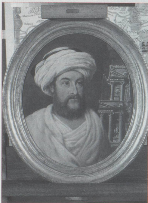
Louis Burckhardt, explorateur

Vers la fin des années soixante-dix, la collection, qui manquait de place à Coppet, fut transférée au Château de Penthes sur la commune de Pregny-Chambésy, petit manoir situé dans un magnifique parc aux portes du quartier international de Genève. Son propriétaire est l'Etat de Genève ; la Fondation en est l'usufruitière.