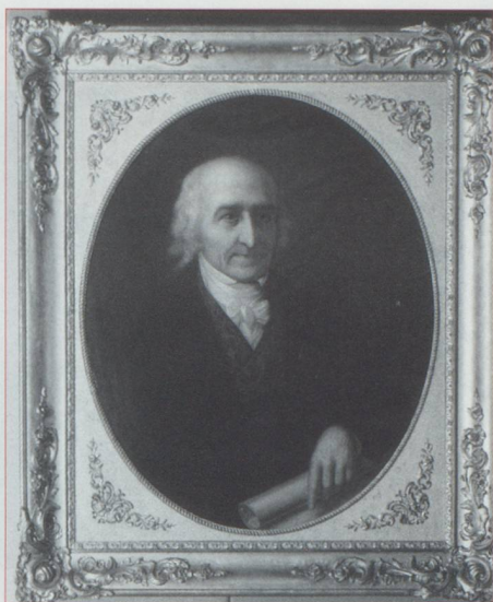
Gallatin, secrétaire au Trésor américain de 1801 à 1814

Mais il y a aussi l'intérêt pour son propre pays qui, en dernière analyse, est un intérêt pour notre personne : qui suis-je ? quelles sont mes racines ? quel sera mon destin ? Sans prétendre que la Suisse et les Suisses puissent faire la leçon aux autres, nous sommes tout de même autorisés à nous poser la question de savoir s'il y a un message dans notre "suissitude", un message d'humanité peut-être ? de droiture ? de qualité dans le travail accompli ? Et sans parler de notre démocratie et du fédéralisme helvétiques comme modèles exportables, au moins pouvons-nous évoquer le respect des diversités, le sens du