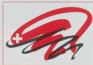
Le nouveau logo de la Fondation est l'œuvre de Jérôme Liniger, Paris.

prononcer des conférences, être présent, visible... On dirait qu'une longue carrière diplomatique n'a été qu'un apprentissage pour une nouvelle période de défis et de réalisations.