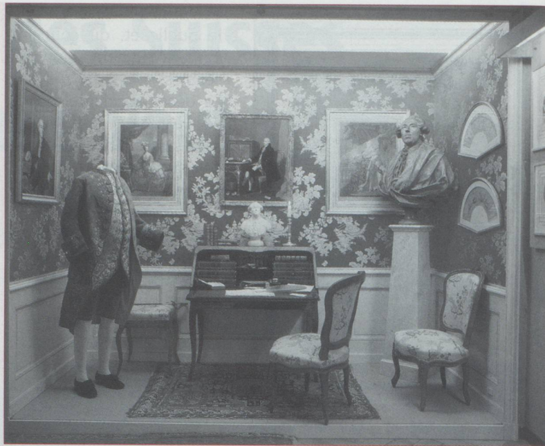
Alcôve Jacques Necker, consacrée au banquier de Louis XVI

d'hôtels de luxe et établi la réputation de la Suisse comme pays du tourisme haut de gamme. N'oublions pas non plus les diplomates et les consuls, dont Carl Lutz, qui a sauvé la vie de soixante mille juifs, à Budapest, pendant la Seconde Guerre mondiale, en leur procurant des papiers pour fuir en Israël. Et faisons honneur à l'architecte Le Corbusier, au constructeur de voitures Louis Chevrolet, à l'astronome Claude Nicollier ou à l'acteur de cinéma Michel Simon, etc.