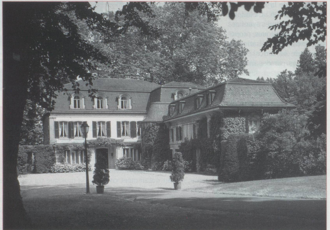
Entrée du château

Voici donc que, jeune retraité et bien décidé à travailler moins, à consacrer plus de temps aux belles choses de la vie, je me retrouve engagé dans une nouvelle aventure, chargé de nouvelles responsabilités qui englobent une panoplie d'activités riches, mais exigeantes, telles que : réfléchir à la raison d'être, au message et à l'avenir d'une institution culturelle exceptionnelle : un musée avec son centre de recherche et de documentation, logé dans un petit château situé dans un des plus