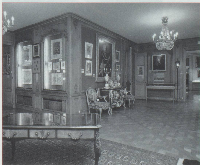
Salle Le Fort

Enfin, pour ne pas devenir trop philosophe ou trop politique, j'aimerais simplement dire le plaisir que l'on peut éprouver en allant à la rencontre de personnages extraordinaires d'hier et d'aujourd'hui, d'êtres humains en chair et en os - même s'ils sont morts depuis longtemps. On peut comprendre l'histoire à travers les grands mouvements de l'esprit, à travers les guerres et les révolutions, les