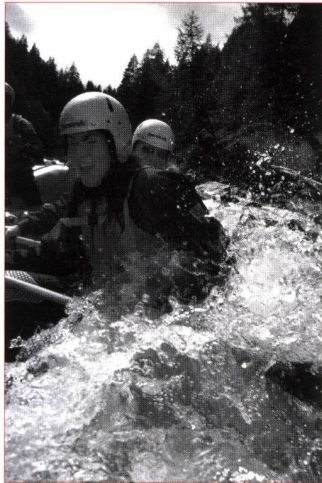
Des sensations pures...

Du côté de Château-d'Oex, la Sarine, parfois furieuse, offre un parcours d'un quinzaine de kilomètres à travers les gorges sauvages du Vanel et