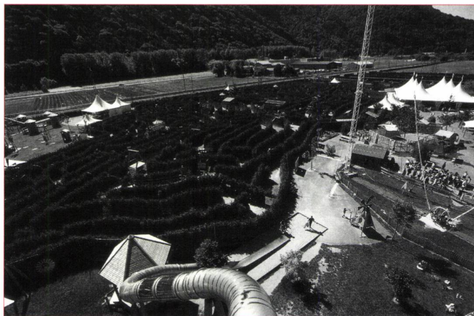
Le "Labyrinthe Aventure" d'Evionnaz, le plus grand du monde

L'univers des fourmis est fascinant. Comment vivent ces insectes toujours affairés et pourquoi cette agitation frénétique ? Comment s'organise cette société à l'intérieur de la fourmilière ? Voilà