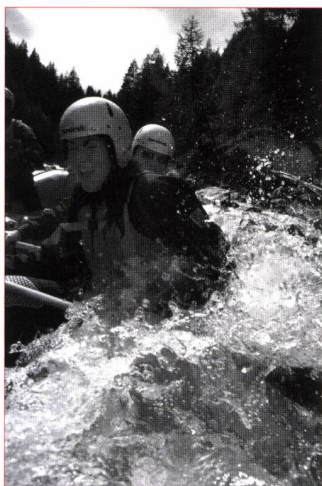
Des sensations pures...

Du côté de Château-d'Oex, la Sarine, parfois furieuse, offre un parcours d'un quinzaine de kilomètres à travers les gorges sauvages du Vanel et