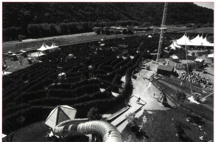
Le "Labyrinthe Aventure" d'Evionnaz, le plus grand du monde

L'univers des fourmis est fascinant. Comment vivent ces insectes toujours affairés et pourquoi cette agitation frénétique ? Comment s'organise cette société à l'intérieur de la fourmilière ? Voilà ▷