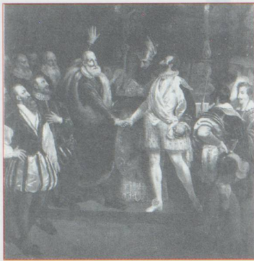
Renouvellement de l'alliance franco-suisse par Henri IV à Paris le 13 Octobre 1602. Tableau de Marigny

▷ modestes tout en canalisant leur énergie guerrière pour son plus grand profit.