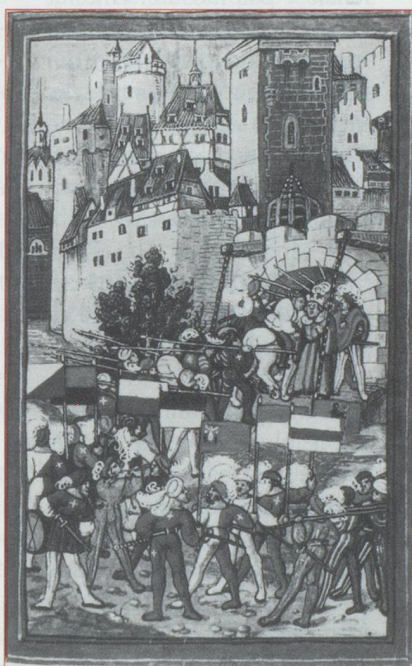
Le roi Louis XI reçoit à Chalon-sur-Saône les troupes suisses de Guillaume de Diesbach, Hans Waldmann et Jacques de Fausigny, le 27 août 1480. C'est le premier contingent fourni officiellement par les Cantons à la France

munication sur les Suisses qui ont en toute simplicité fait la Révolution française 4 . Quand on cite les grandes dates de l'histoire de France, une des premières qui vient à l'esprit c'est Marignan 1515 : Quand l'historien