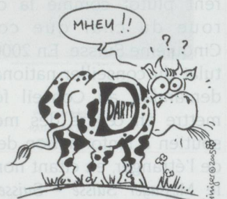
NOUVEAU PAYSAGE SUISSE...

■ Le géant de l'électroménager français Darty veut ouvrir sept à huit magasins en Suisse romande dans les trois ans. Venant chasser sur les terres de Media Markt, Fust et Interdiscount, le groupe vise l'équilibre dès la deuxième année d'exploitation. Darty s'implantera d'abord dans le canton de Vaud (Crissier, Villeneuve, Etoy) avant d'essayer dans le reste de la Suisse romande.