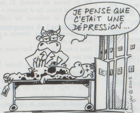
ERREURS DE DIAGNOSTICS...