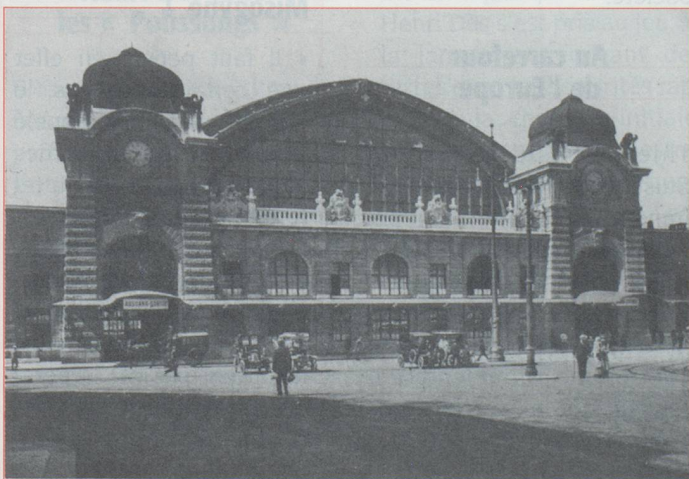
Bâle : gare centrale