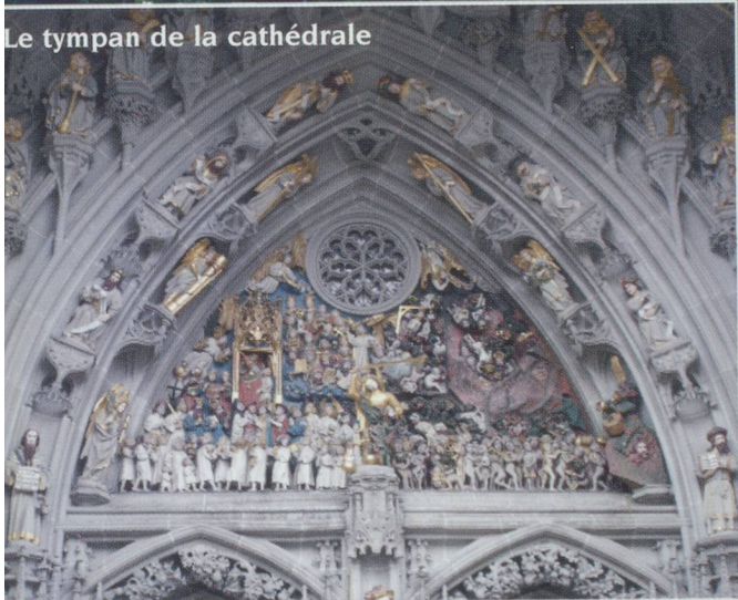
Le tympan de la cathédrale