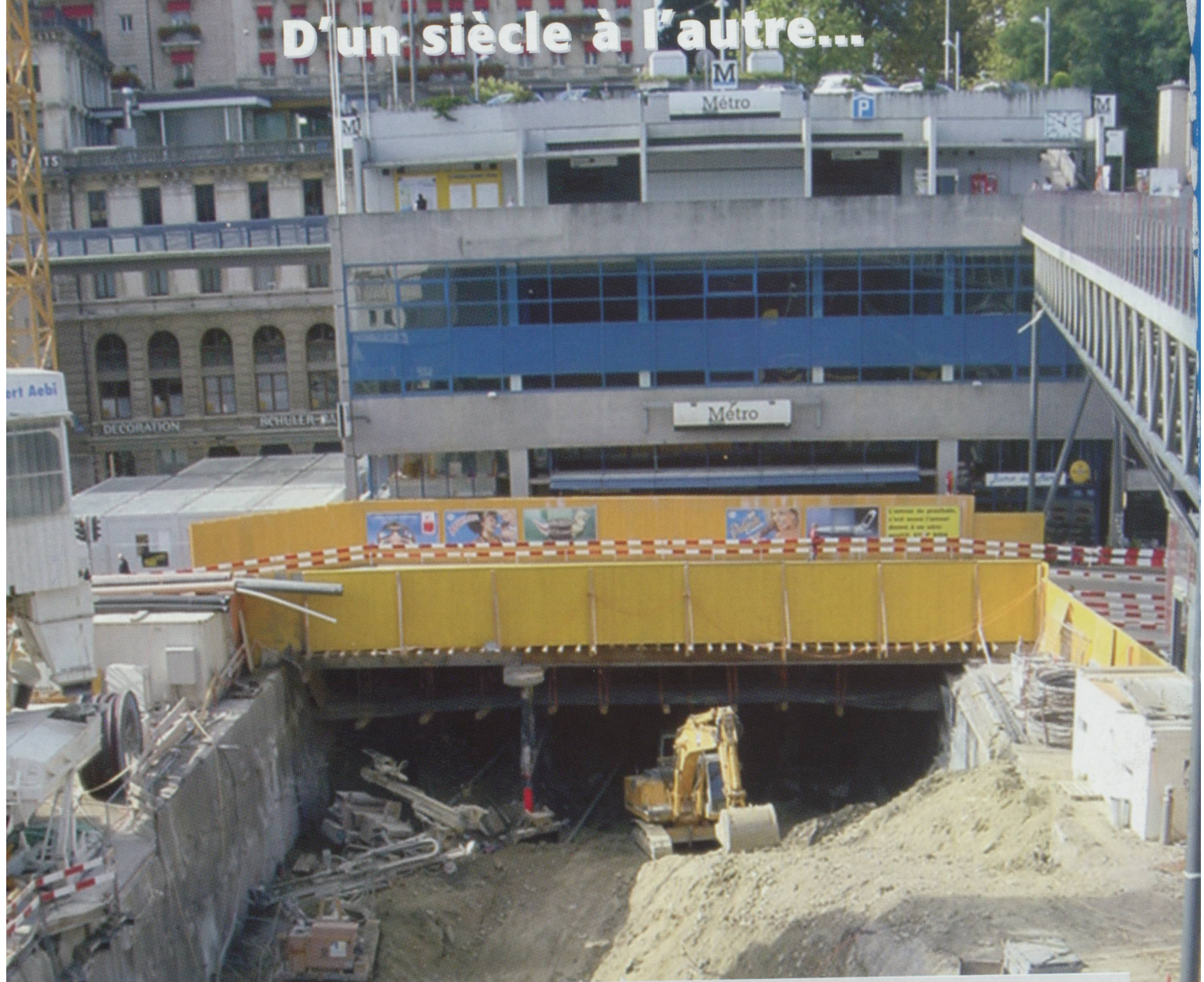
Lausanne - Place du Flou - La maison Mercier et la Gare Lausanne-Ouchy