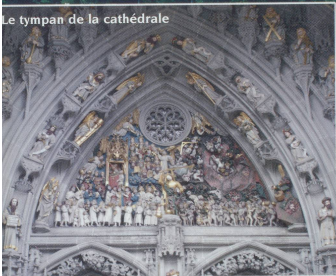
Le tympan de la cathédrale