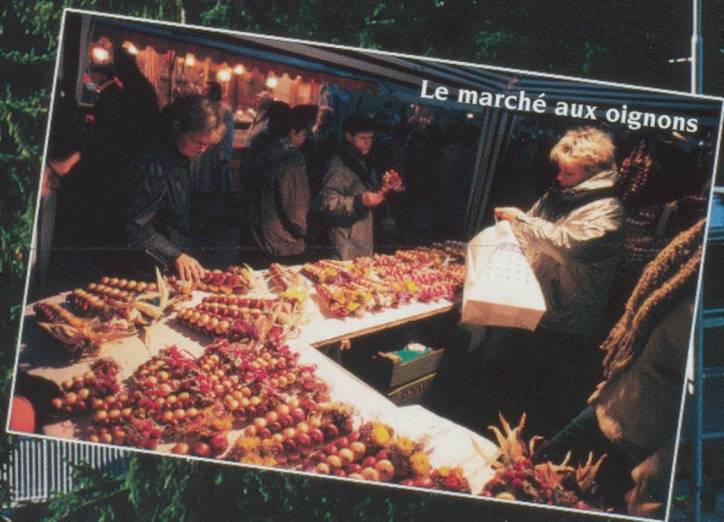
Le marché aux oignons