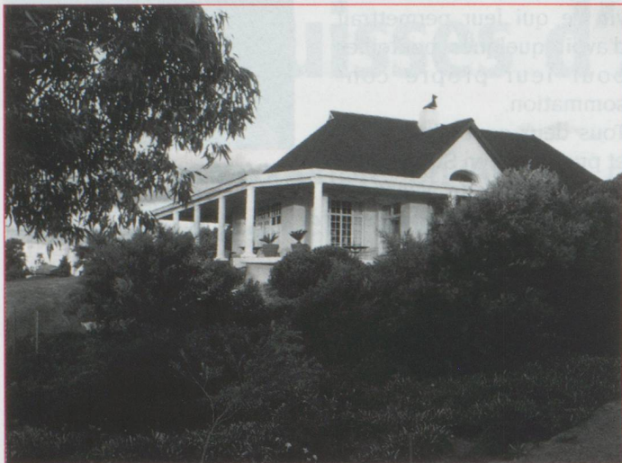
Chez Georges Schwegler Bellavista Country Place

▷ en Angleterre, lors de vacances en Afrique du Sud elle tomba éperdument amoureuse du pays et de celui qui allait devenir son mari, un homme d'affaires couronné de succès, avec lequel elle séjourna dans les plus beaux hôtels du monde, notamment en Suisse. En 1977, elle acheta un hôtel une étoile à Plettenberg Bay avec l'intention de le transformer en maison familiale. Mais avant de réaliser son rêve, elle perdit son époux. Son caractère de battante lui interdisait de rester inactive et la carrière d'hôtelier lui sembla être une heureuse thérapie. Ce n'était pas son